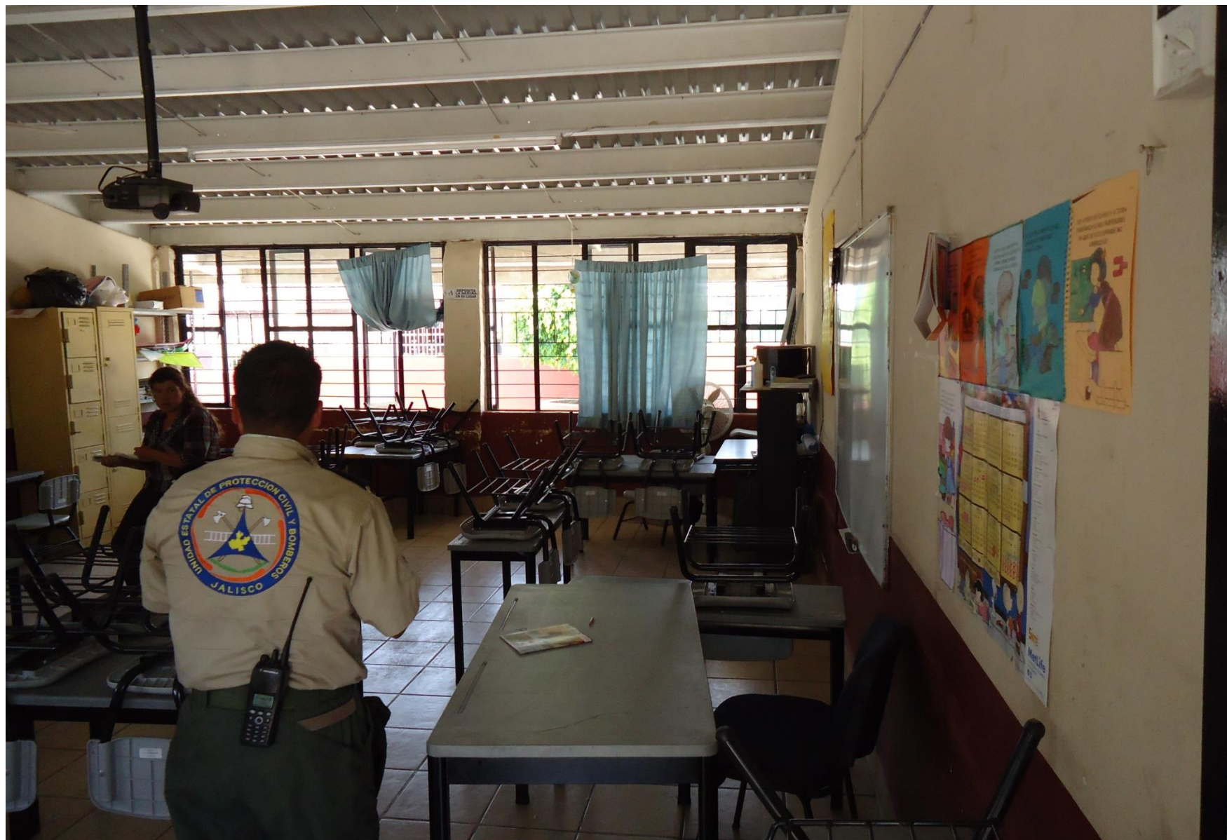
Revisión de Inmuebles que pueden funcionar como Refugios Temporales