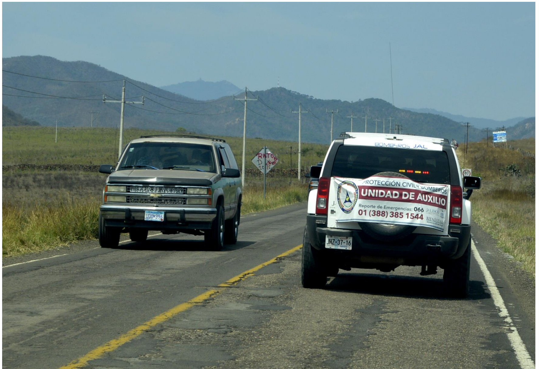
Unidades de Auxilio en carreteras del Estado de Jalisco