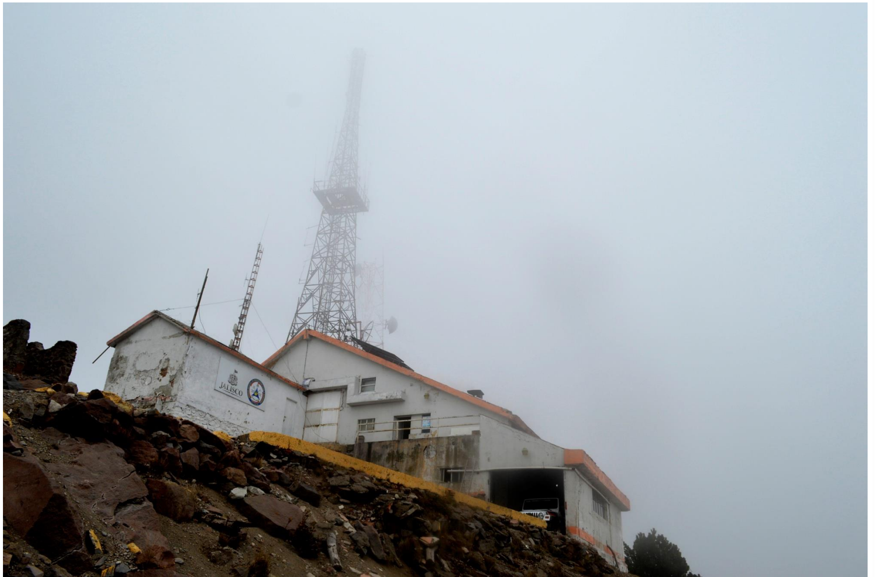
Observatorio Vulcanológico Parque Nacional Nevado de Colima