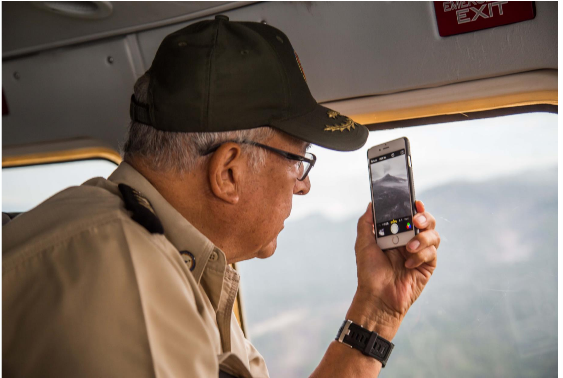
Supervisión Sobrevuelo de Observación. Julio 17, 2015