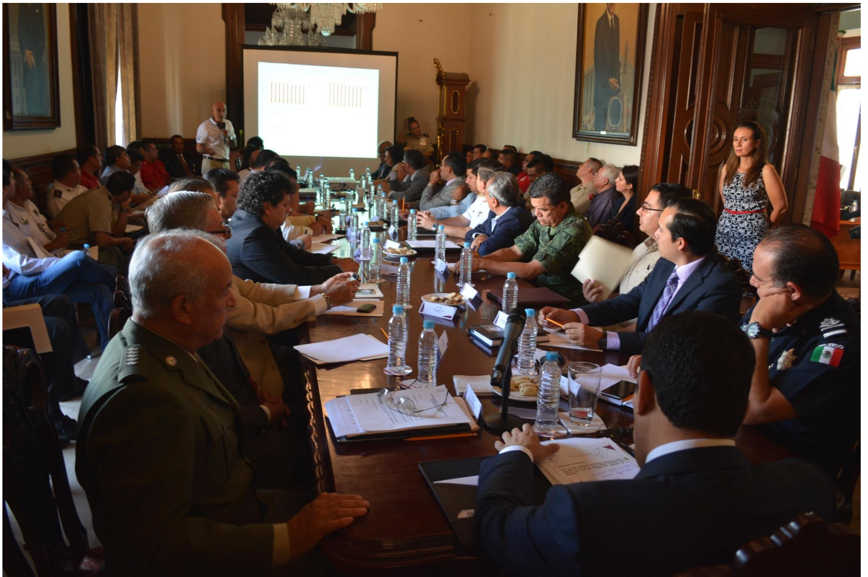
Reunión Interinstitucional, Temporal de Lluvias 2015