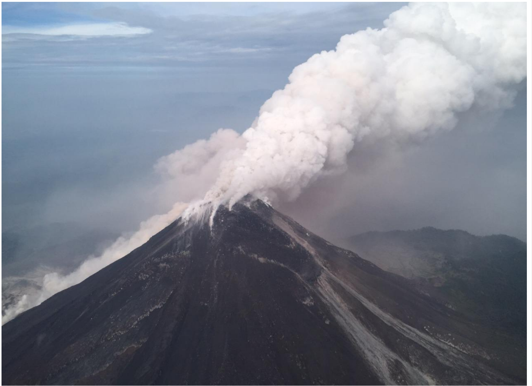
Sobrevuelo de Observación Volcán El Colima. Fumarola Julio 11, 2015