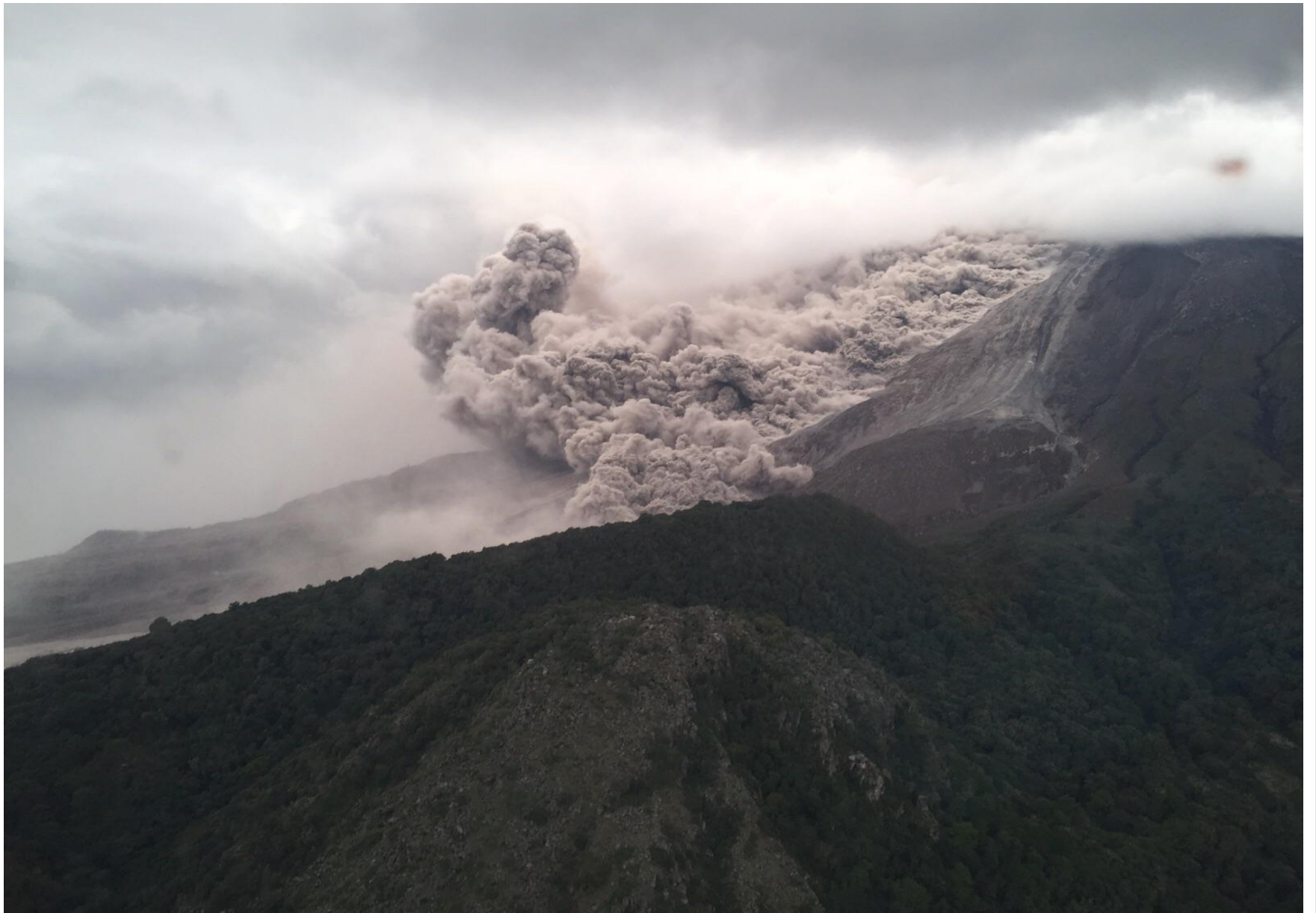
Sobrevuelo, salida flujos piroclásticos. Julio 12, 2015