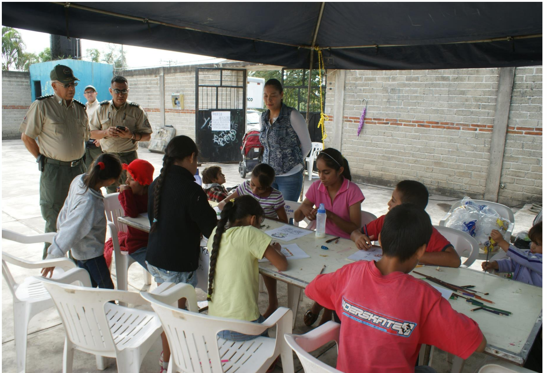
Supervisión del Refugio Temporal en San Marcos, Tonila, 13 de julio de 2015