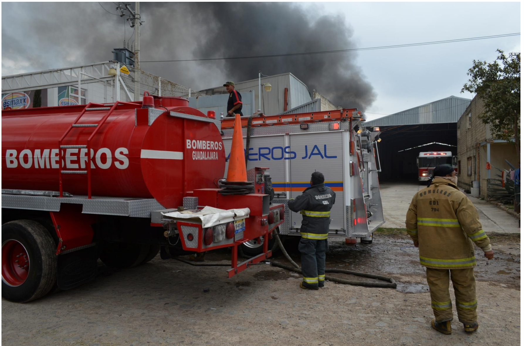
Atención a emergencias ocasionadas por Incendios en Zona Metropolitana