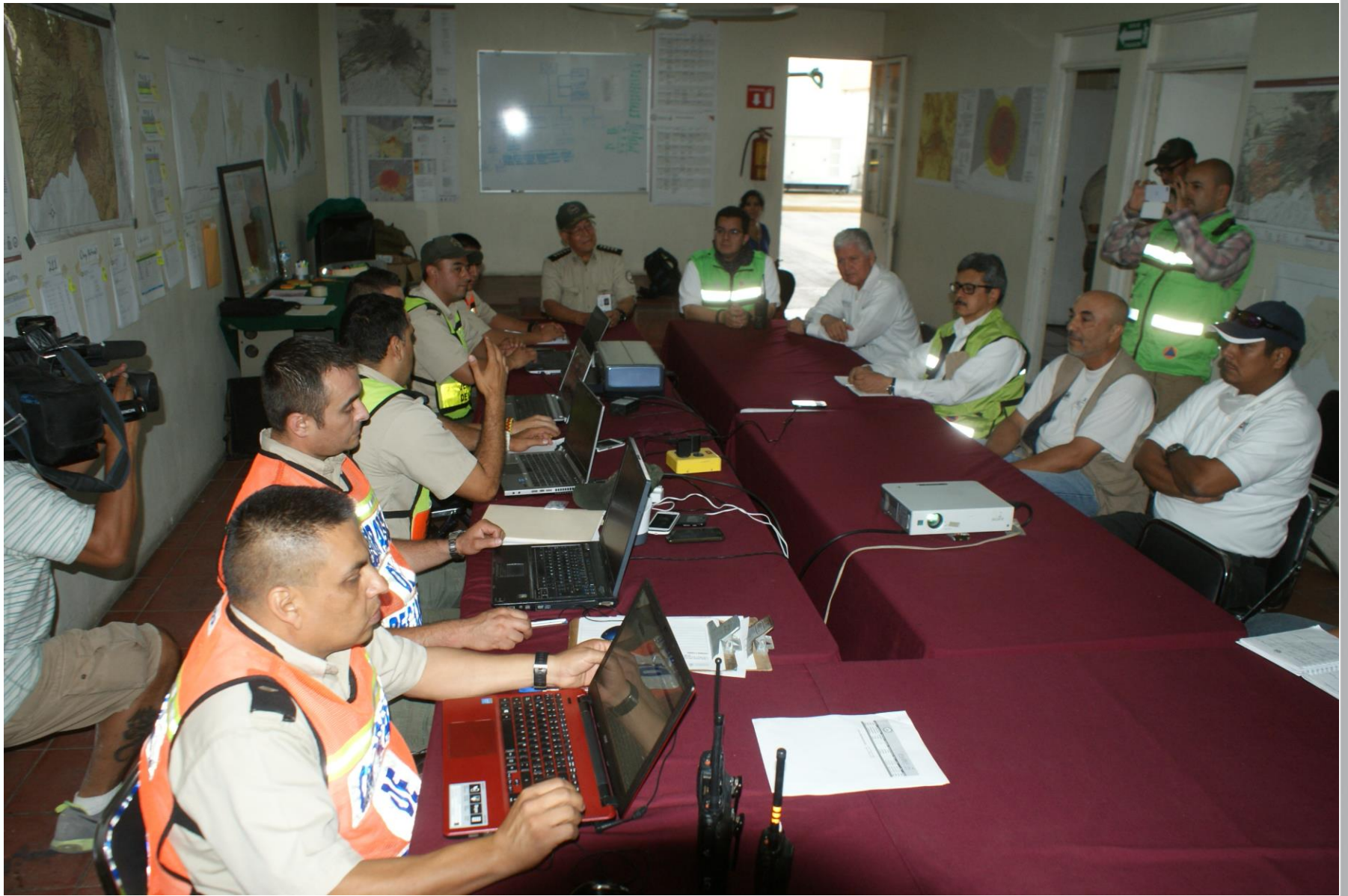
Puesto de mando, Sistema de Comando de Incidentes, Plan Volcán El Colima