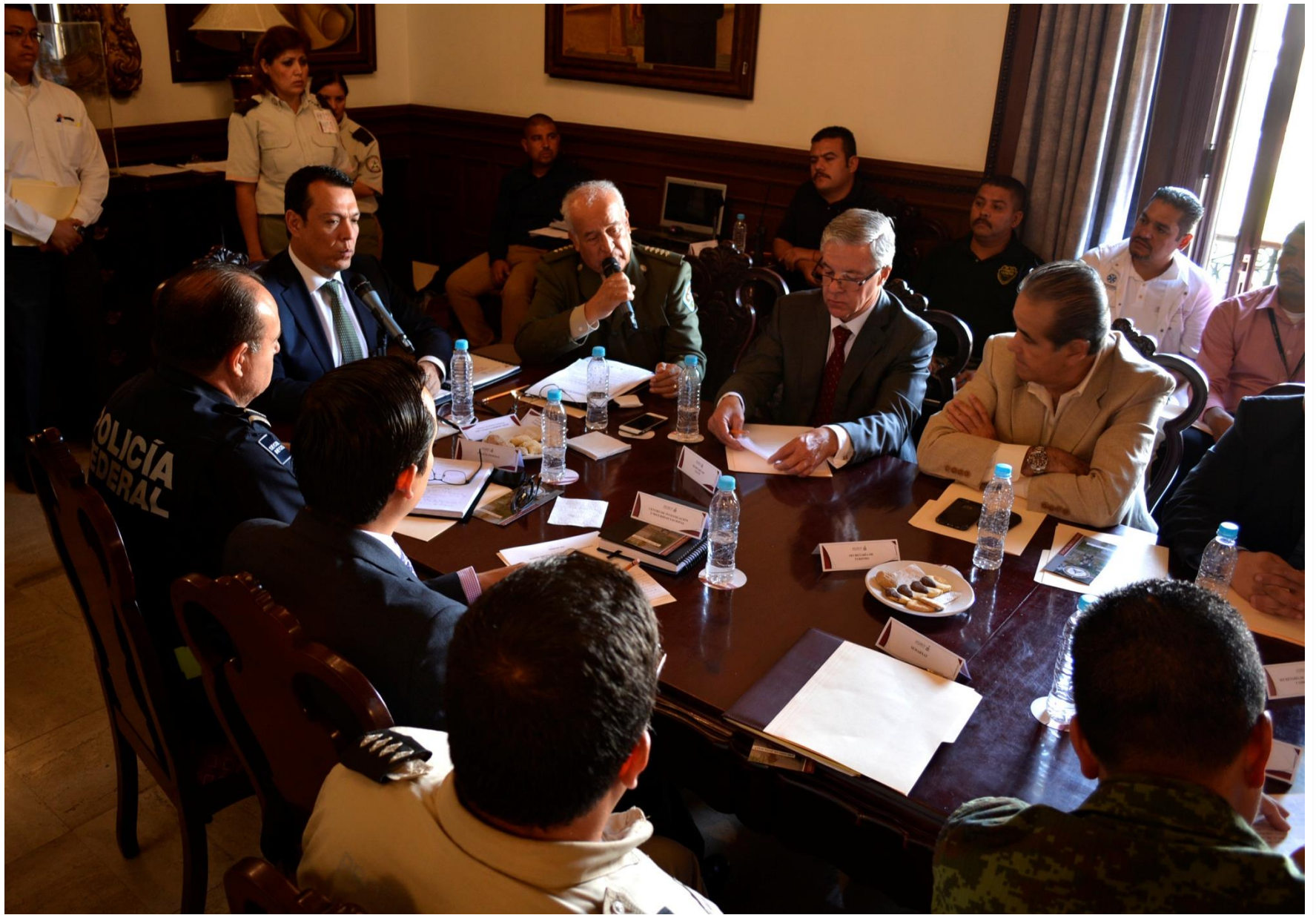
Reunión Interinstitucional, Temporal de Lluvias 2015