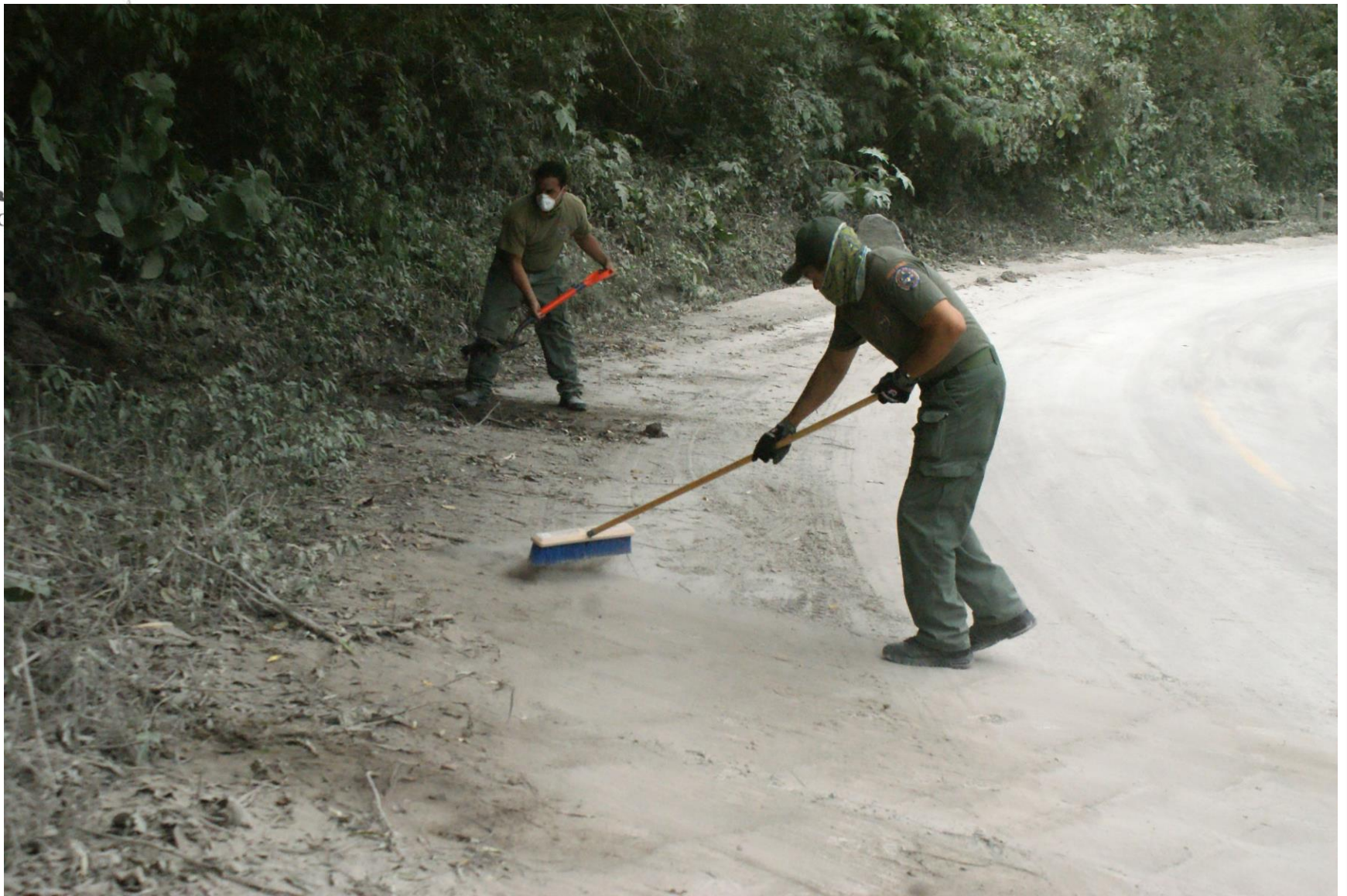
Limpieza de Ceniza en la Carretera Zapotitlán de Vadillo – Comala.