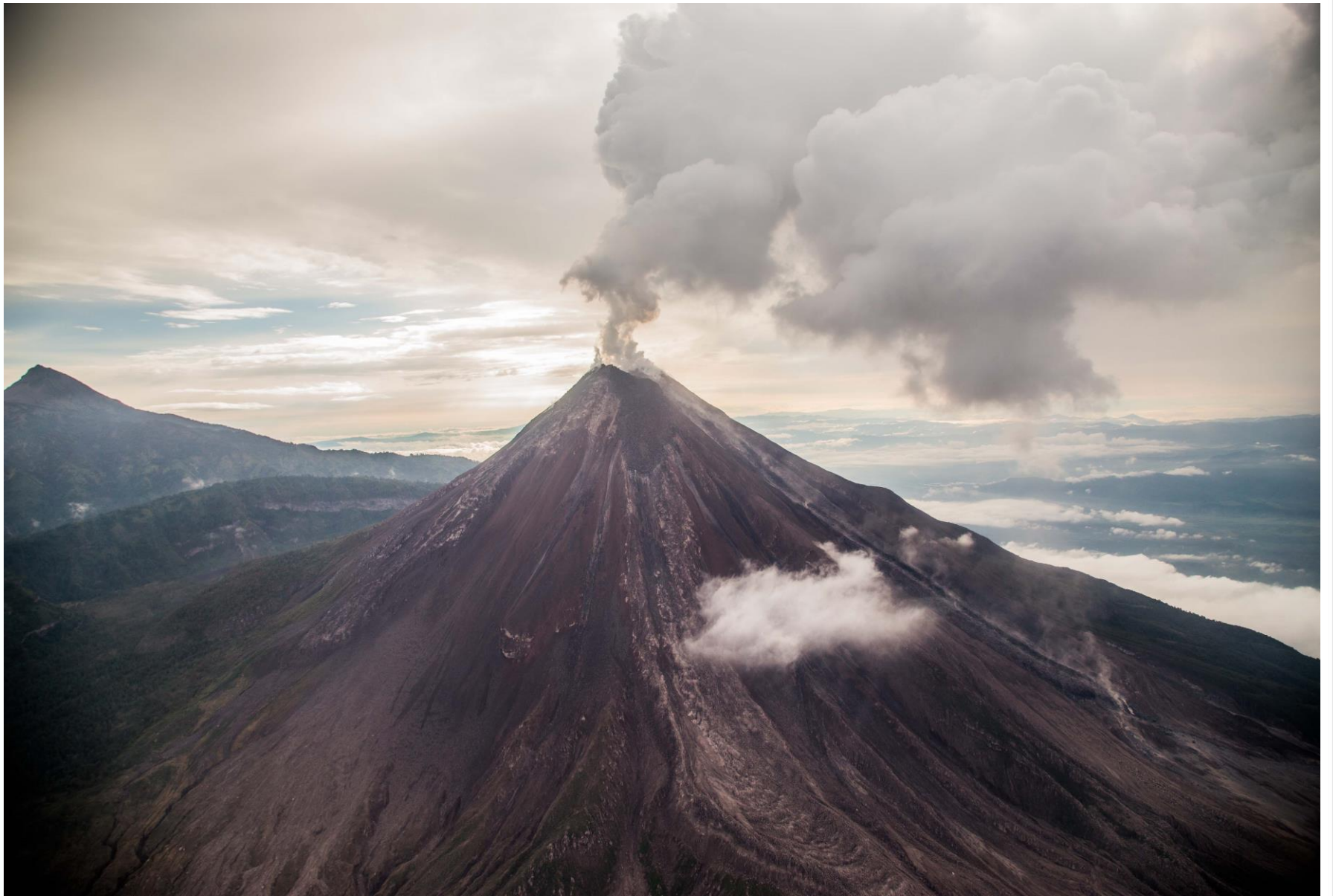
Cuerpo Volcánico Julio 17, 2015