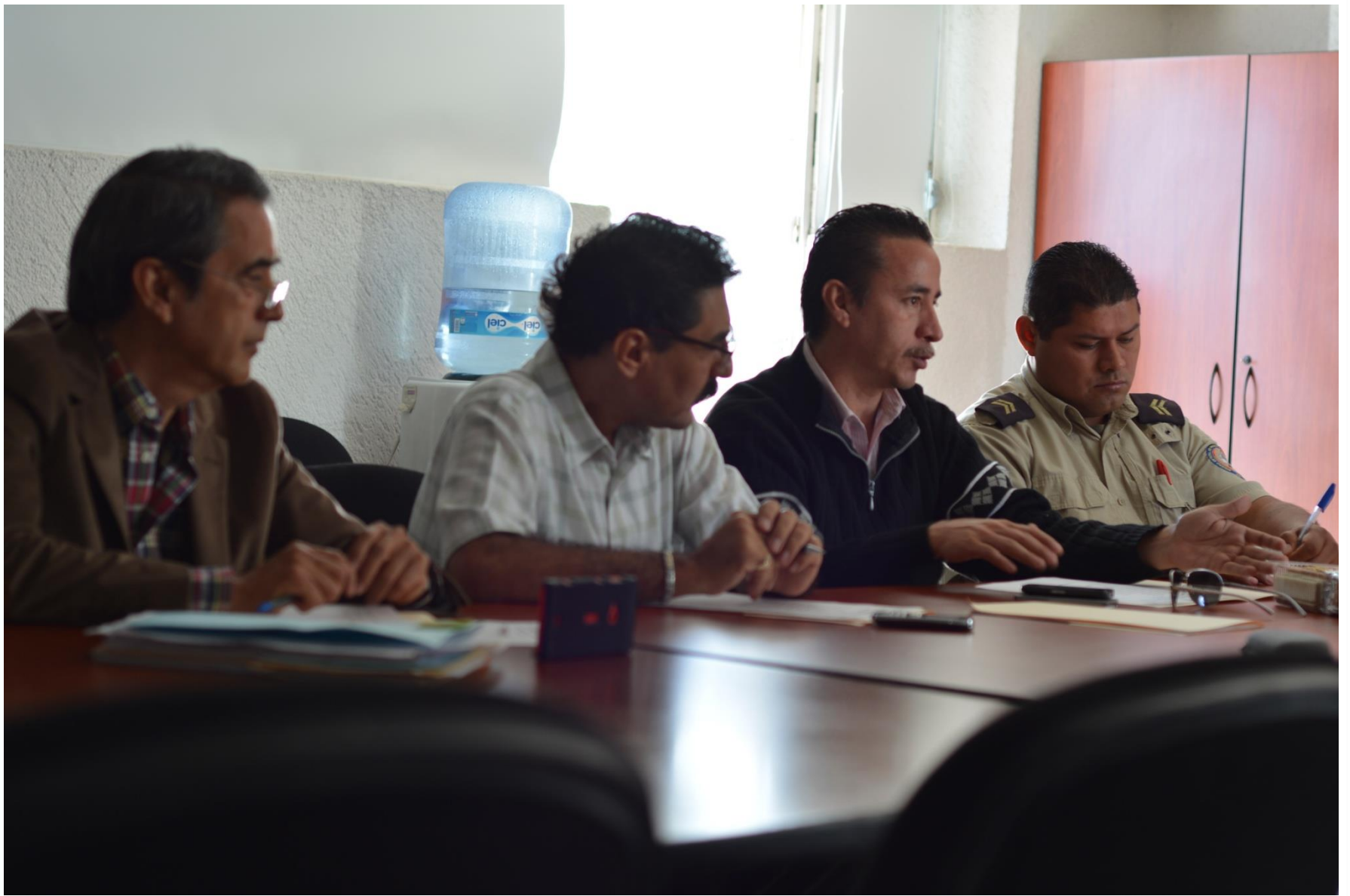
Reunión Interinstitucional, Comité Estatal de Evaluación del Programa Hospital Seguro en Jalisco