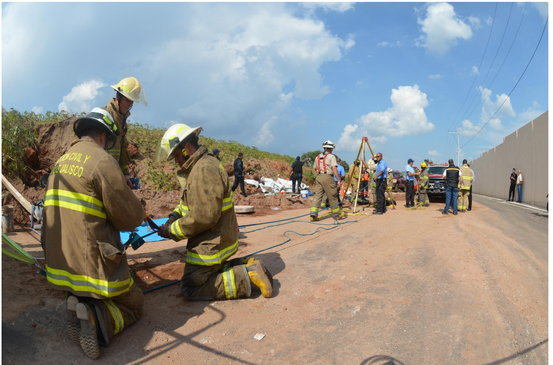
Rescate de personas atrapadas en espacio confinado en zona rural