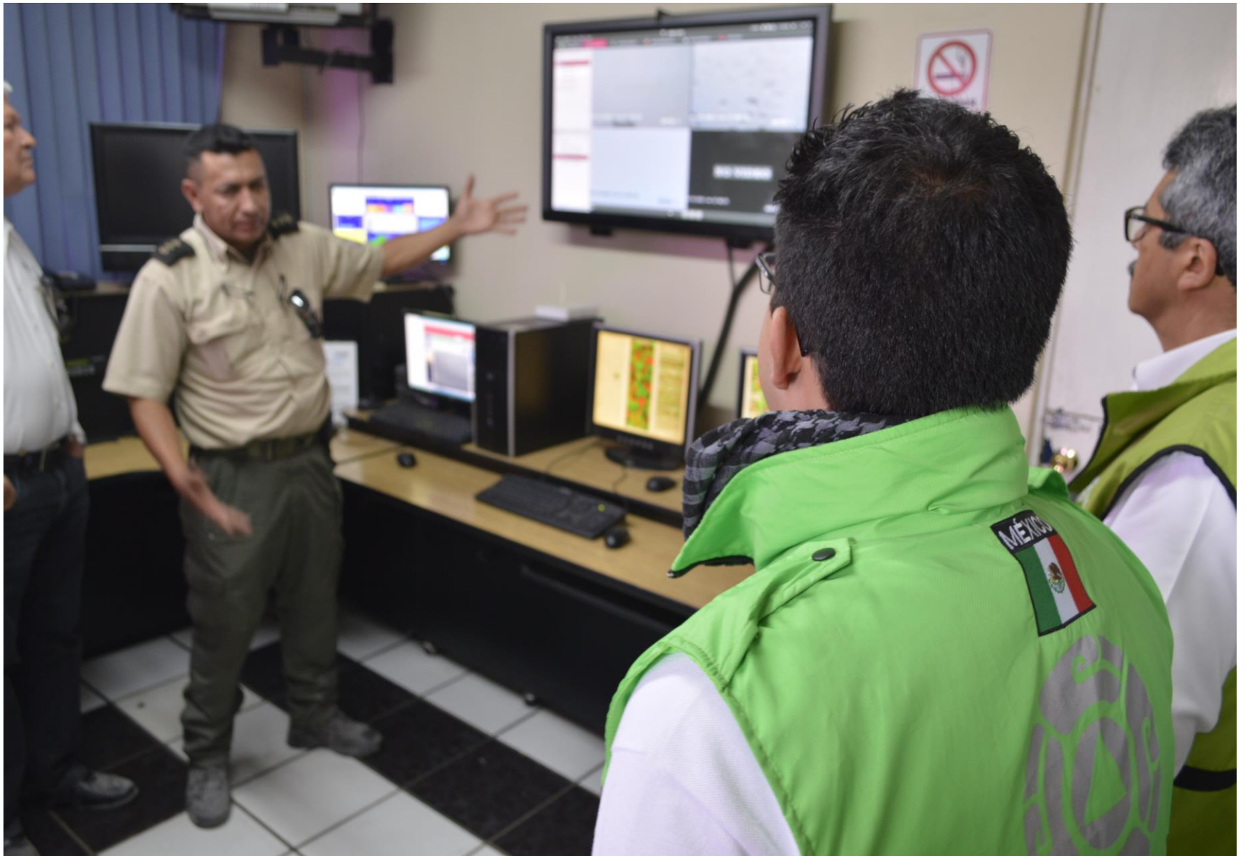
Sistema de Monitoreo Volcán El Colima, ubicado en la Base Regional Ciudad Guzmán