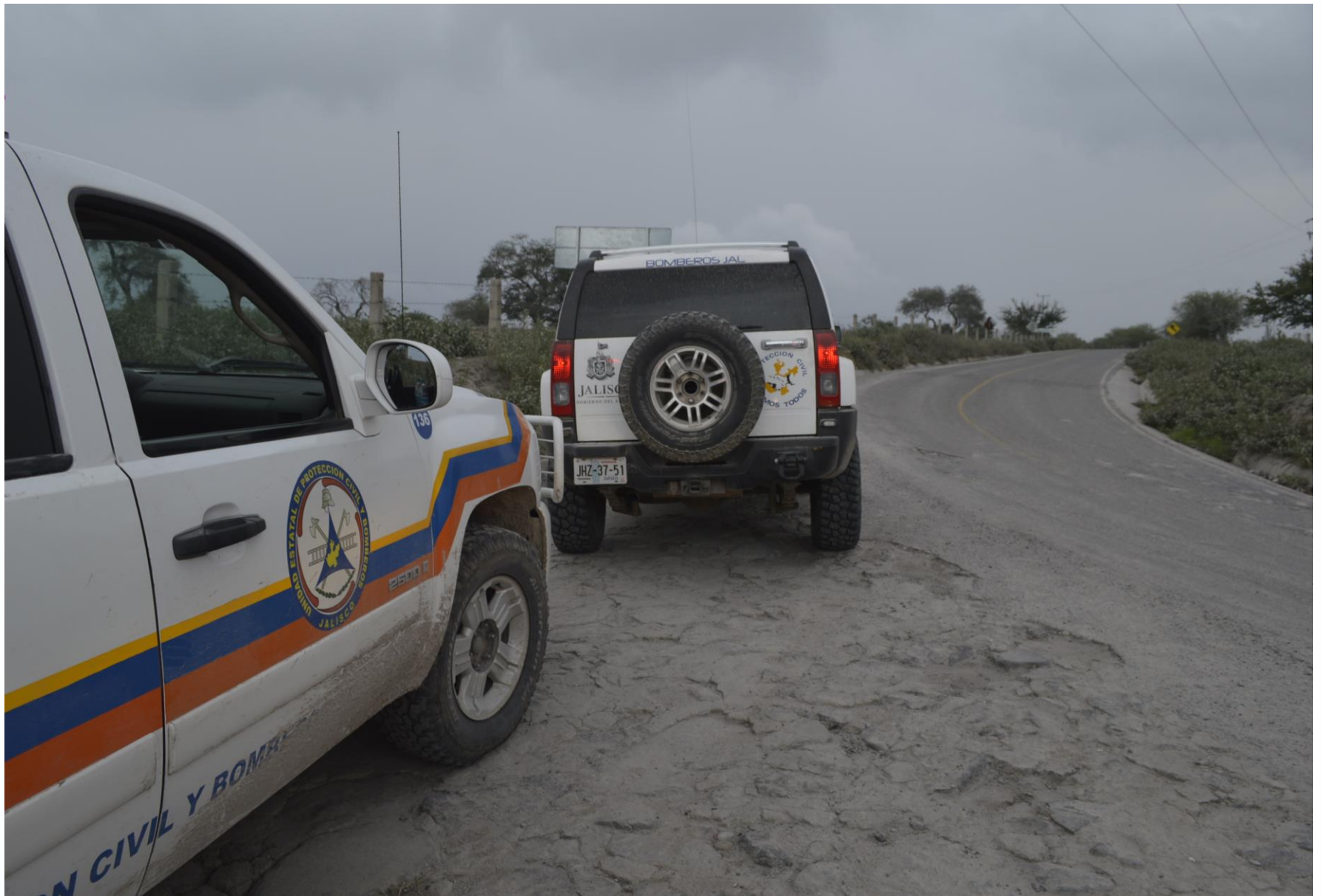
Supervisión de Carreteras y Localidades cercanas al volcán