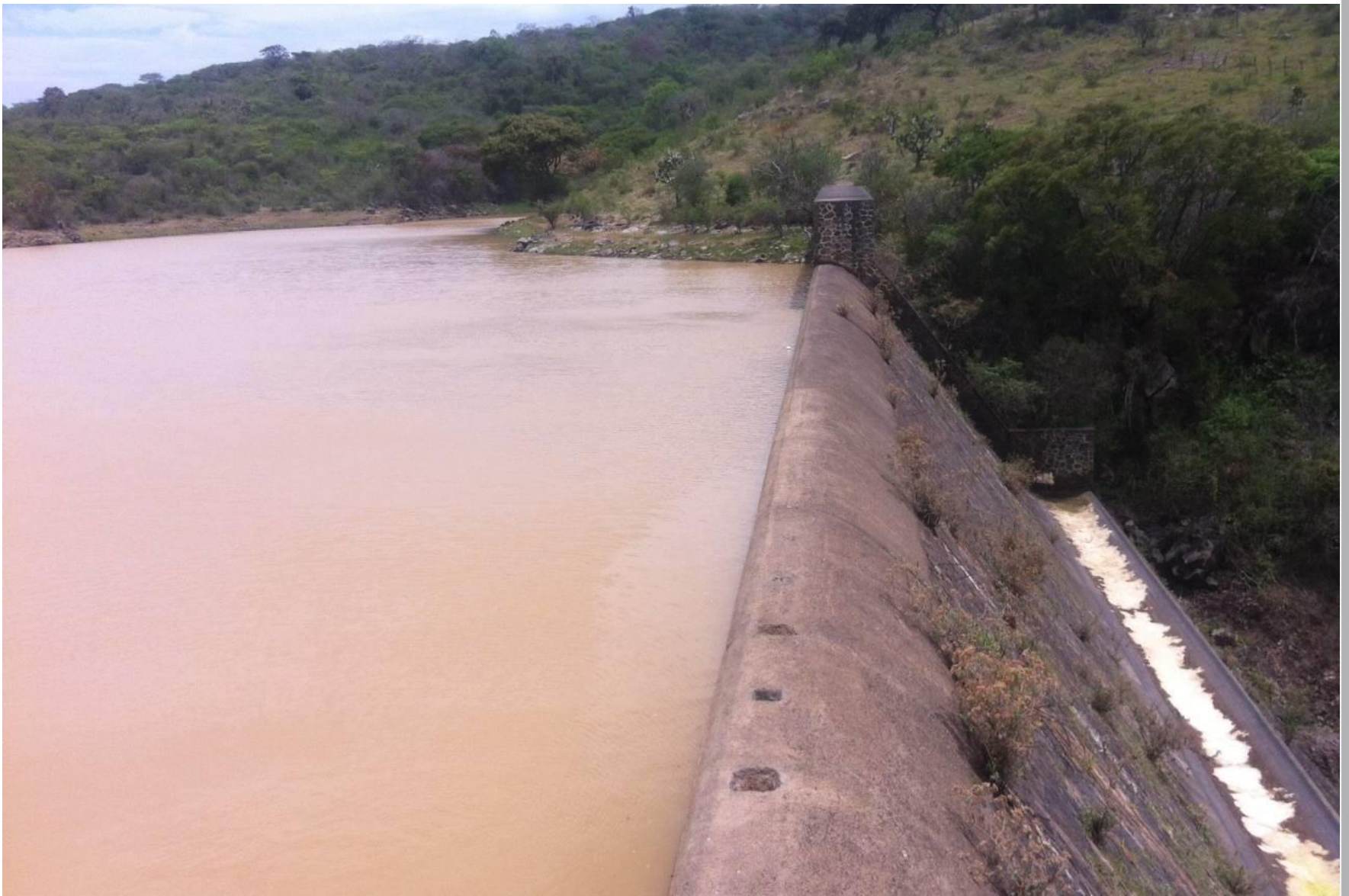
Revisión de Presas Huejotitlán. Teocuitatlán de Corona