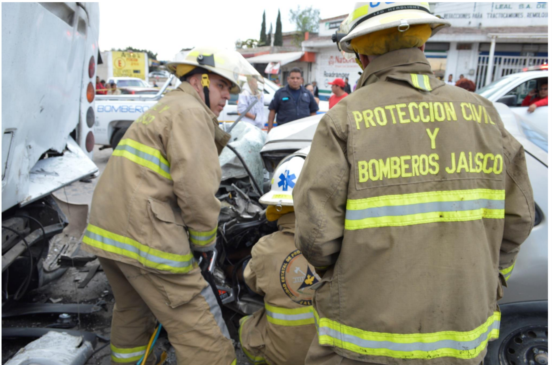
Atención a Accidentes Vehiculares en Carreteras del Estado de Jalisco