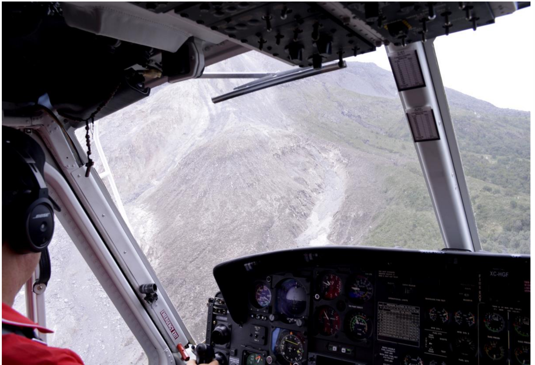
Sobrevuelo de Observación. Julio 14, 2015