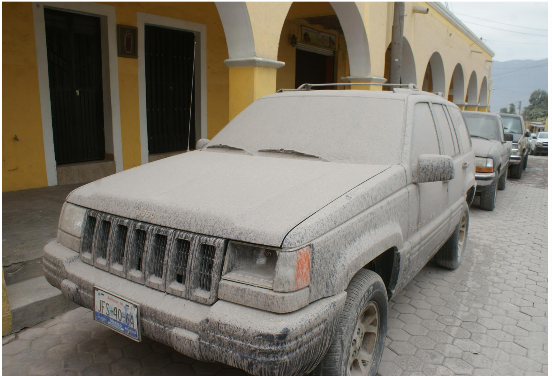
Caída de Ceniza en la cabecera municipal de Zapotitlán de Vadillo