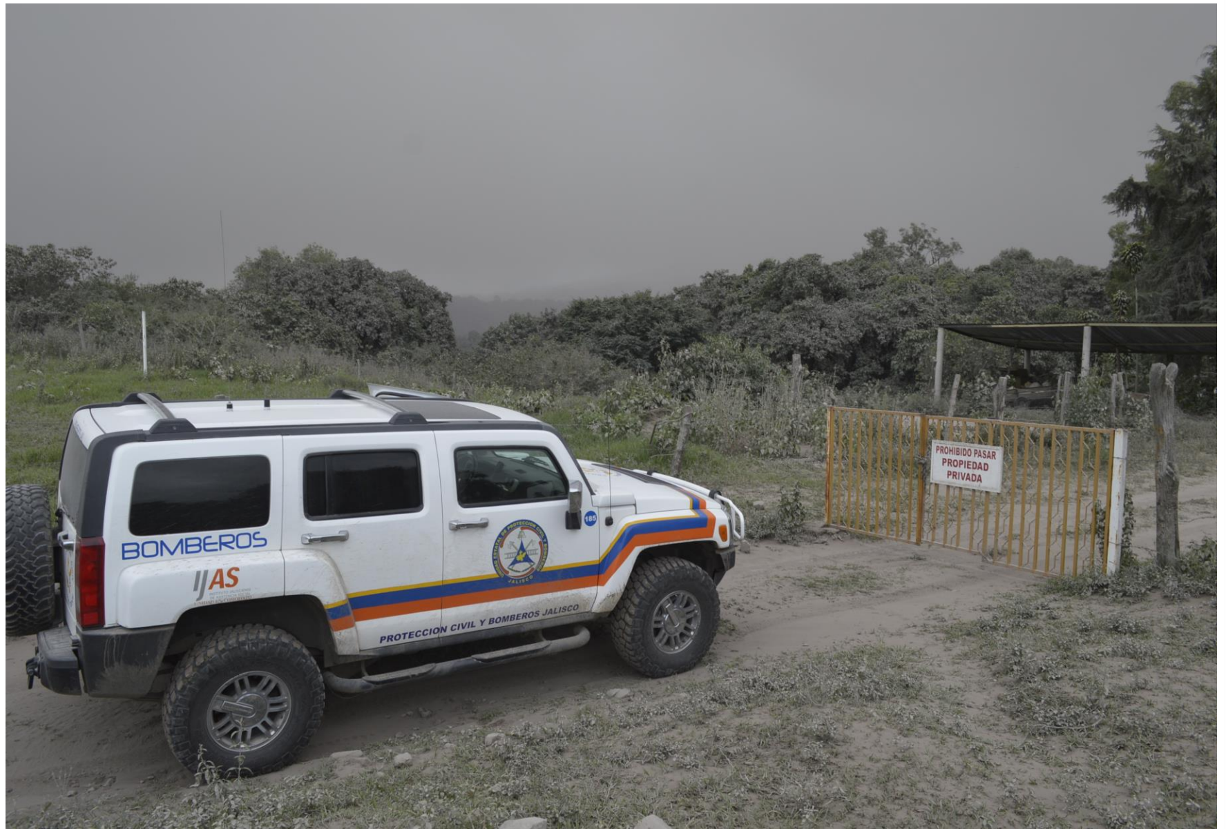
Supervisión en la comunidad de El Borbollón.