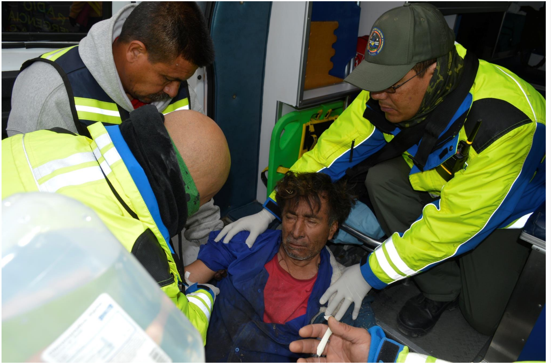
Operativo Candelaria, San Juan de los Lagos