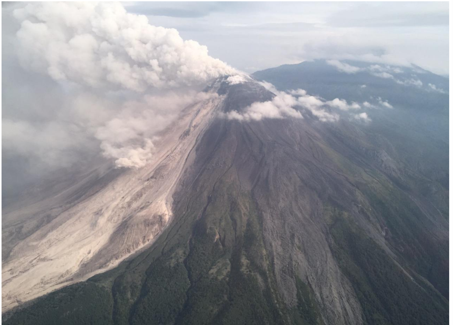
Sobrevuelo de Observación cuerpo volcánico Flanco sur. Julio 12, 2015