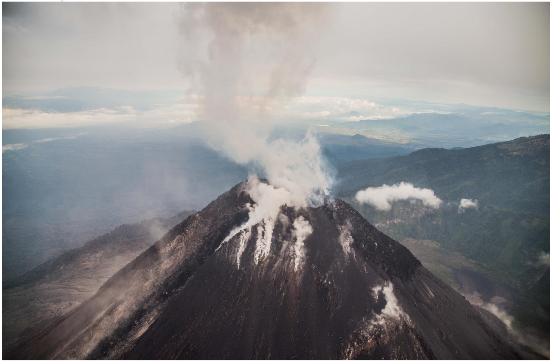
Vista Cráter Sobrevuelo . Julio 17, 2015