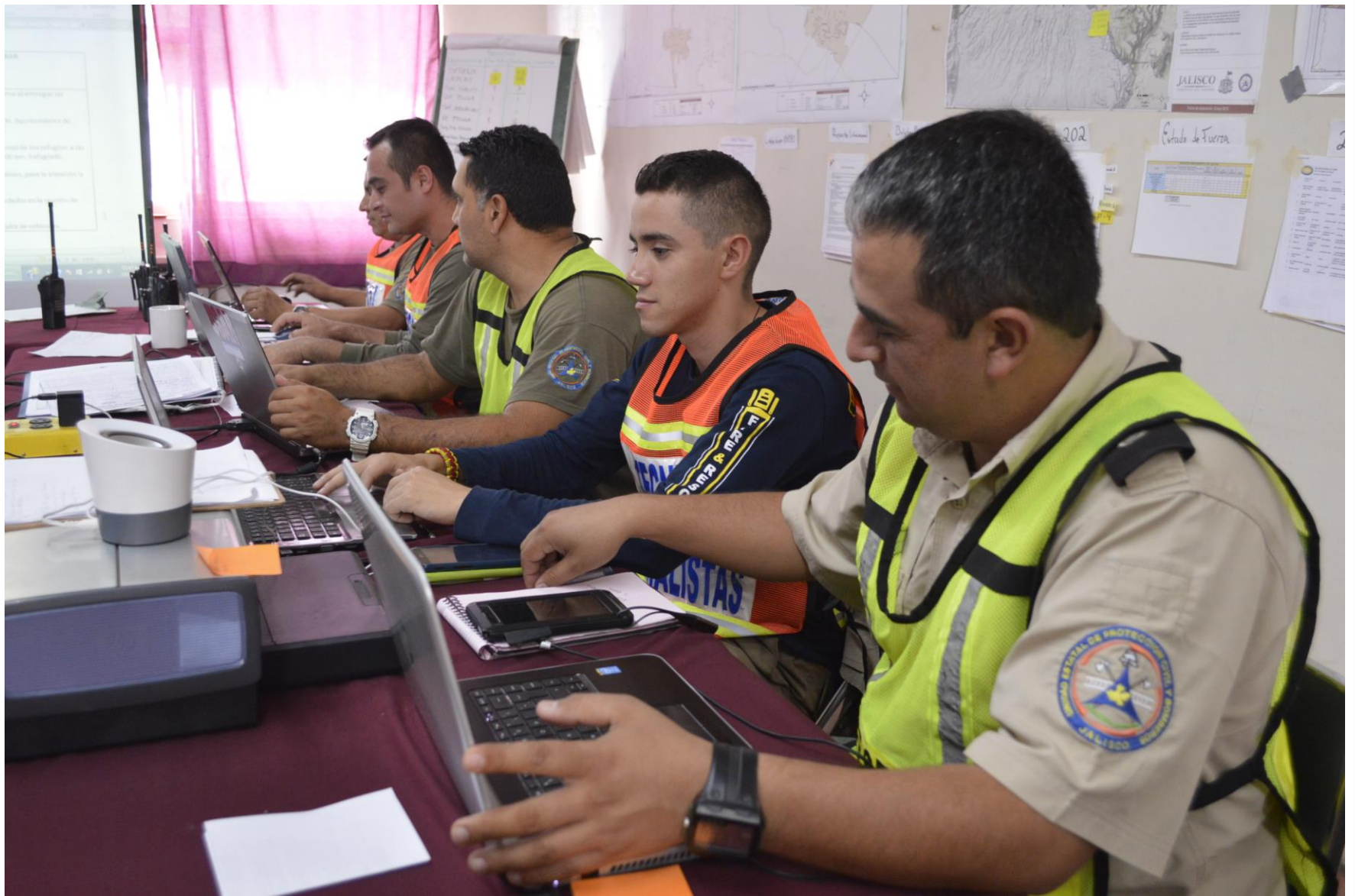
Puesto de Comando SCI. Base Regional Ciudad Guzmán