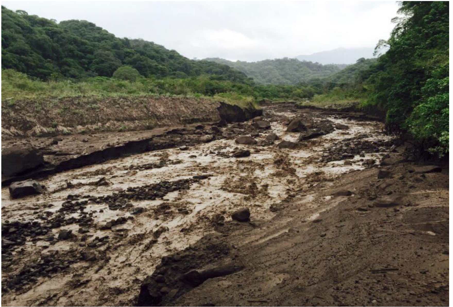
Lahares en Barranca La Lumbre. Julio 21, 2015