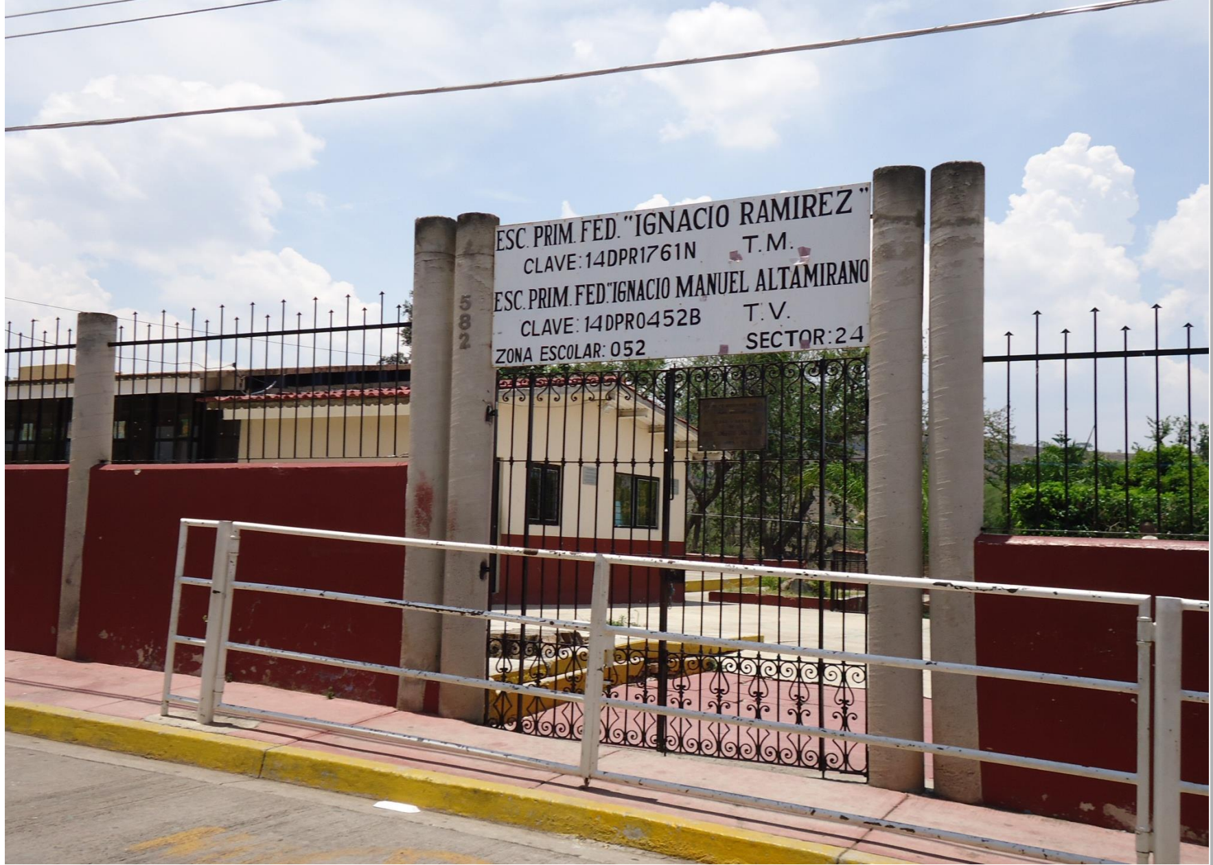
Revisión de Inmuebles que pueden funcionar como Refugios Temporales