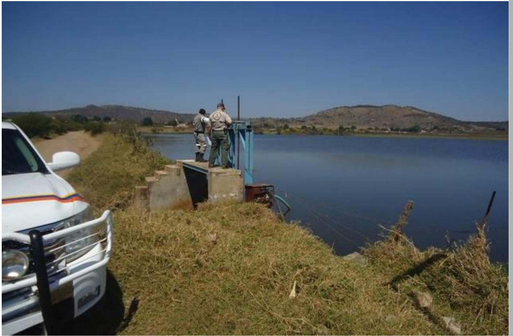
Revisión de Presas, Bordos, Cauces y Zonas de Riesgo