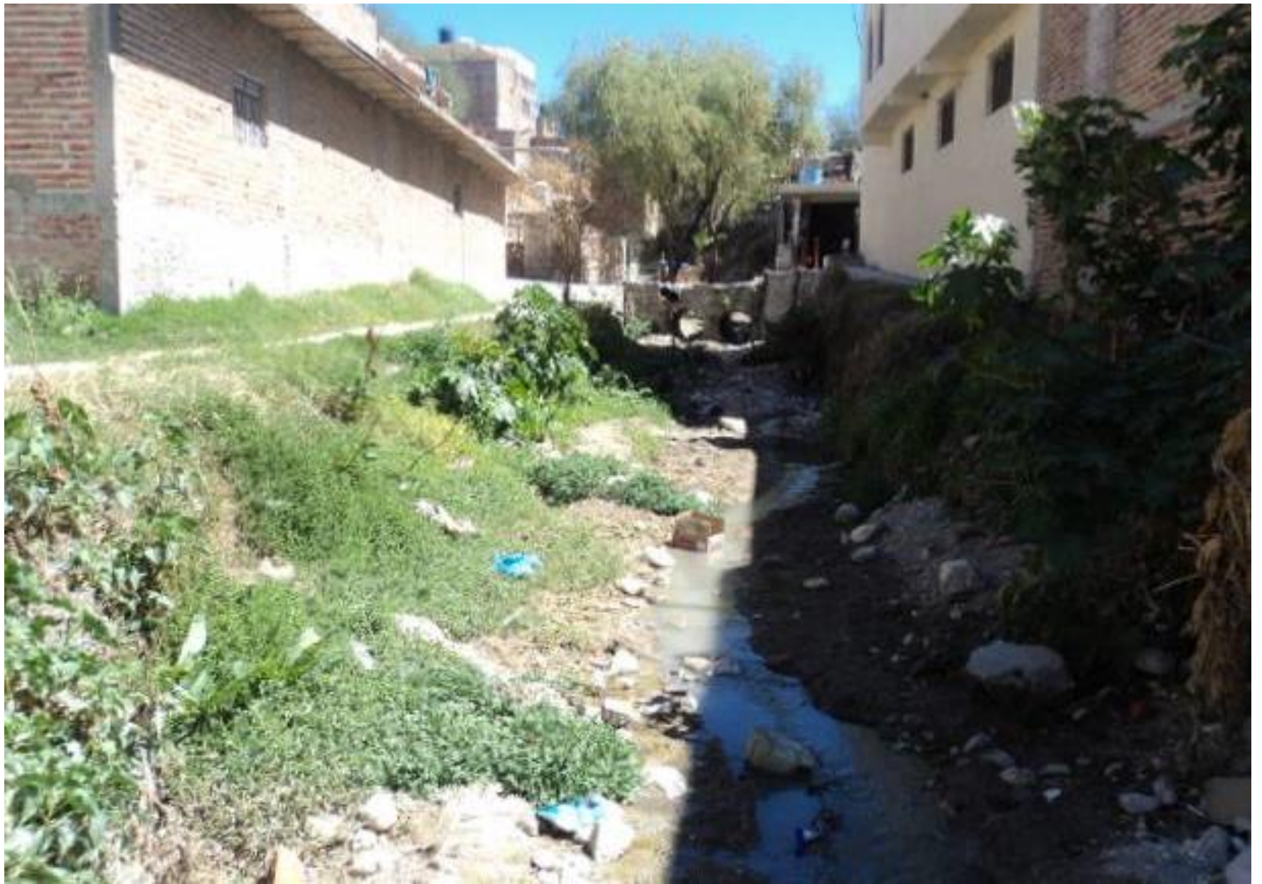
Arroyo el Pocito en San Juan de los Lagos