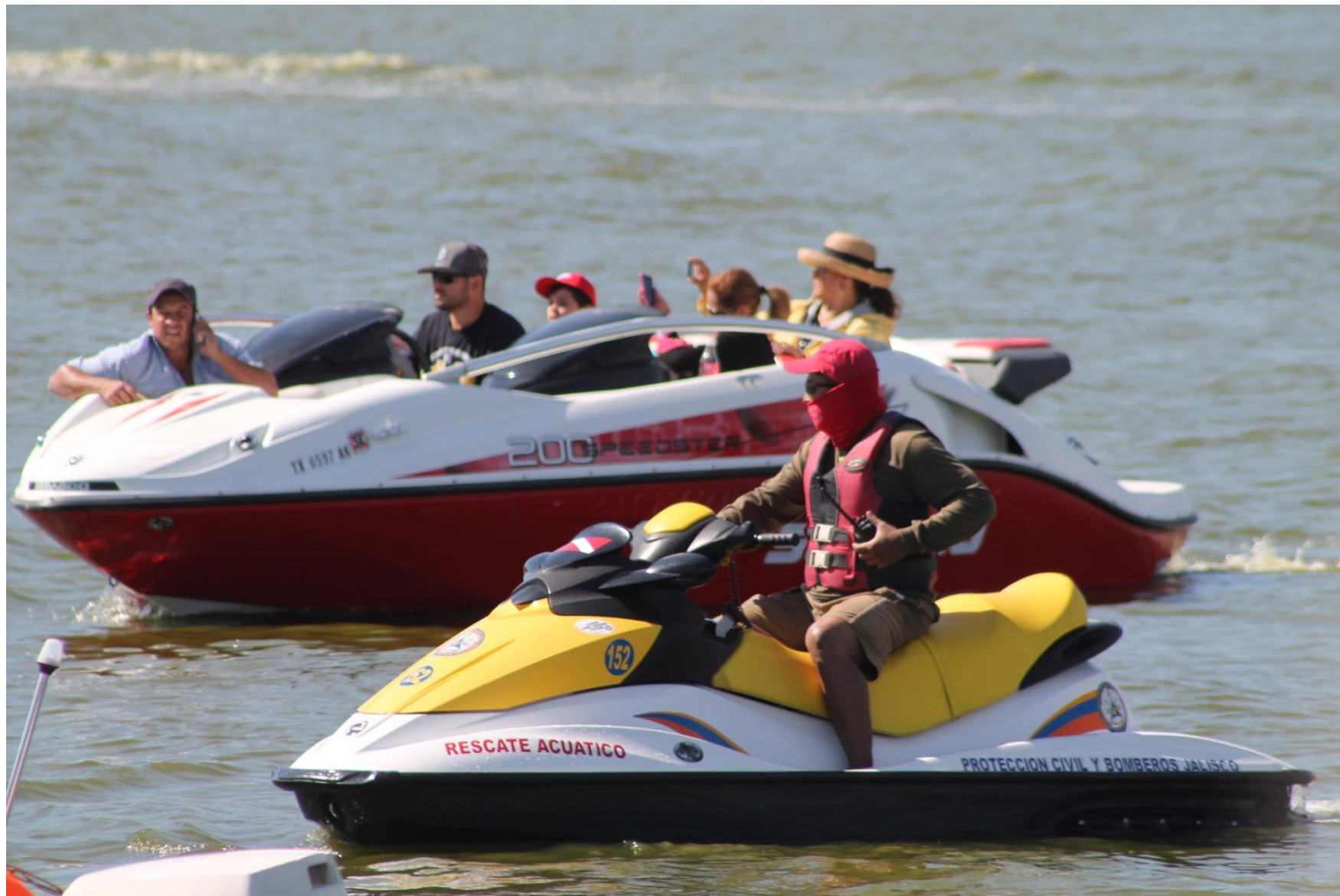
Prevención Celebración Reyes Magos 2015, Cajititlán