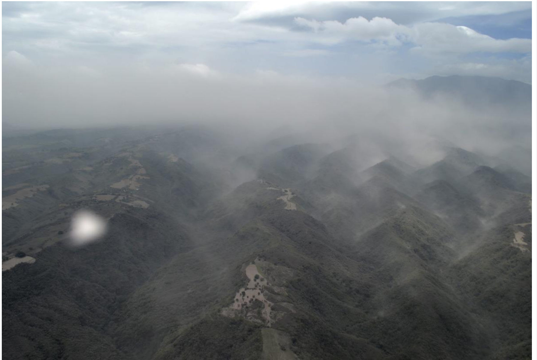
Ceniza Volcánica sobre el municipio de Zapotitlán de Vadillo. Julio 14, 2015