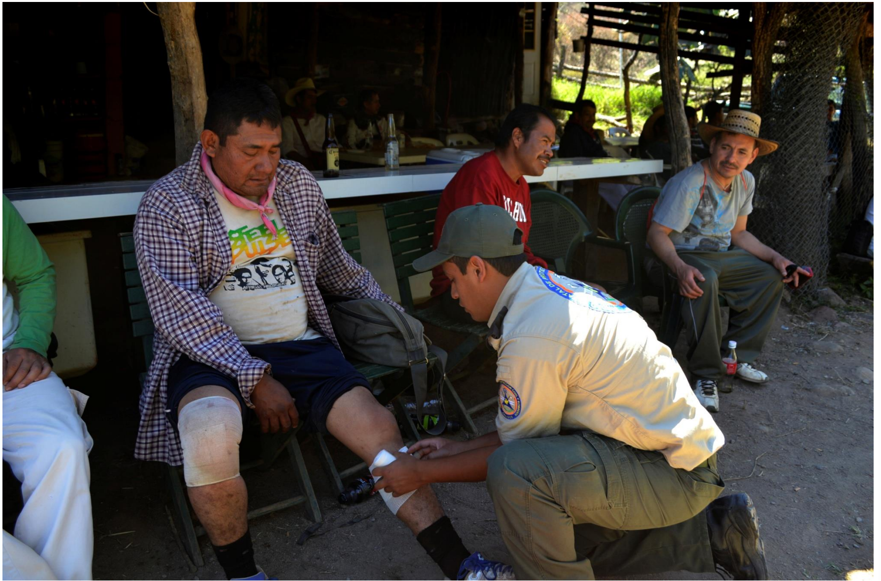
Operativo Romería Talpa de Allende