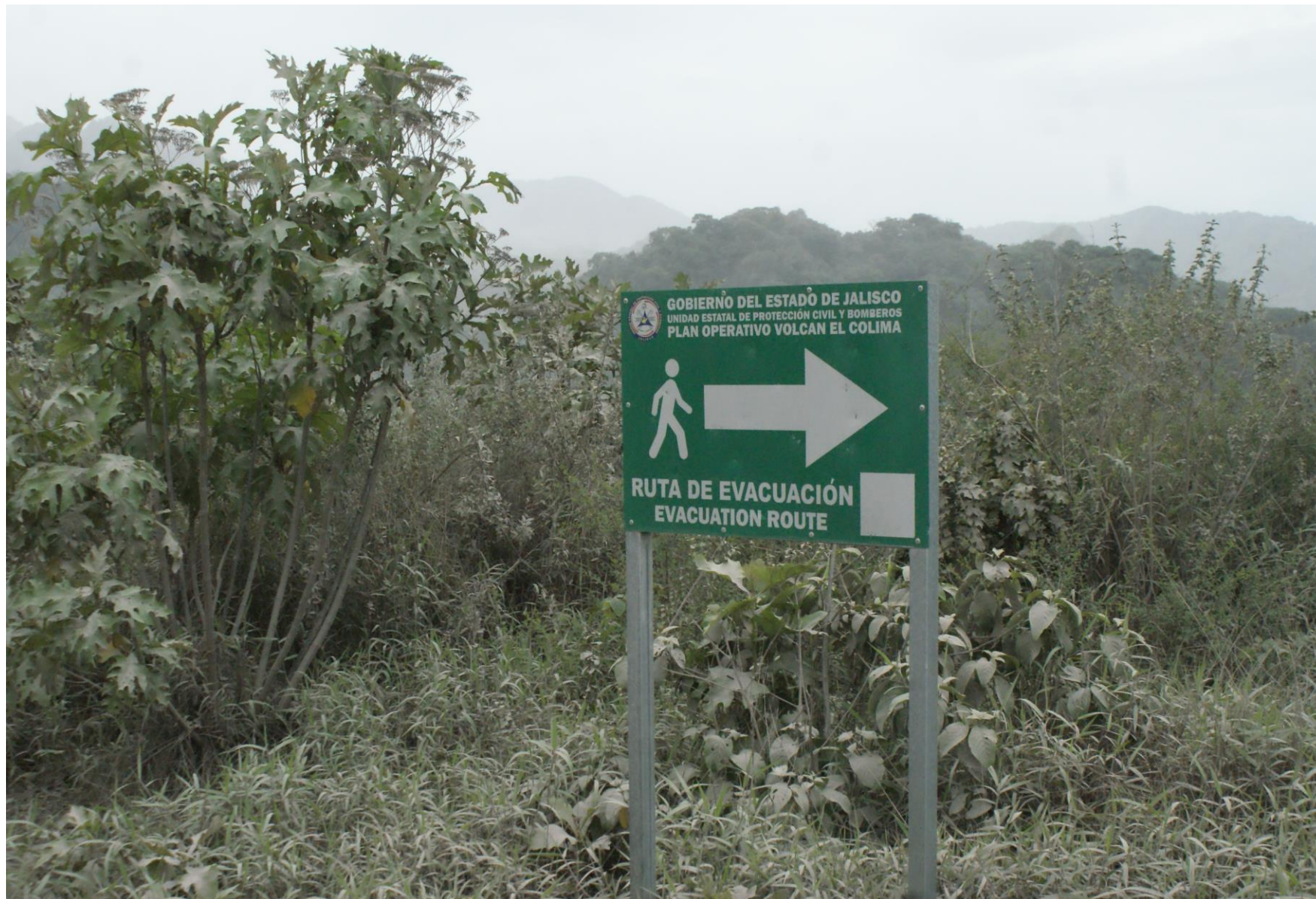
Ruta de Evacuación Operativo Volcán El Colima