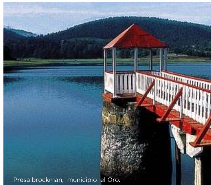
Presas Brockman, municipio El Oro.